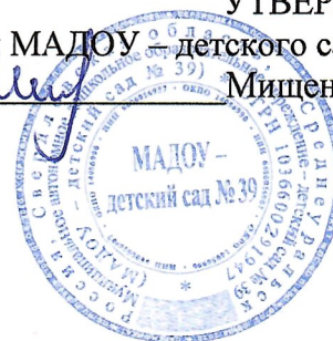
График работы сотрудников МАДОУ – детского сада № 39